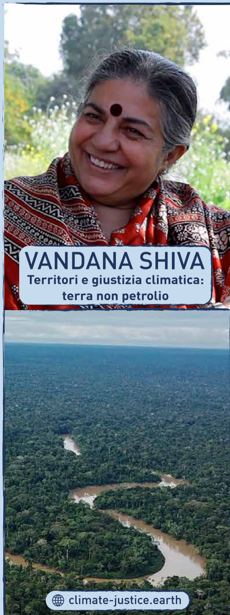
VANDANA SHIVA Territori e giustizia climatica: terra non petrolio

Dibattito | 13.30 - Conclusione prima sessione