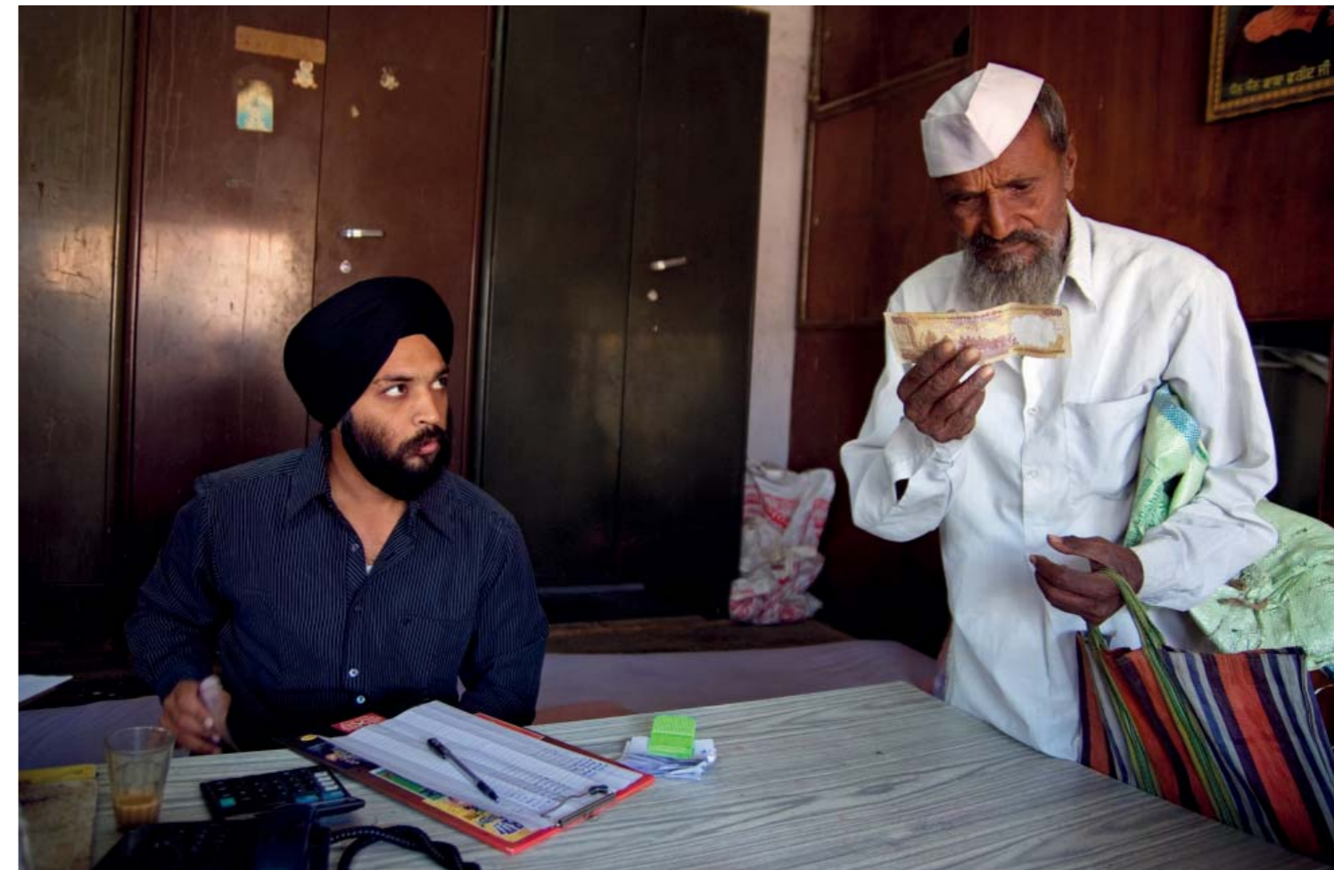
Los marchantes son uno de los múltiples problemas con que se enfrentan los campesinos indios. Pertenecientes la mayoría a casta elevadas (en este caso marchante miembro de la comunidad Sigh), compran la cosecha a los campesinos a precios irrisorios para luego especular y venderla cuando el precio sube. (Washim, Maharashtra, India, enero 2010).

El ánimo de lucro y maximizar éste es su principal objetivo, por encima de cualquier otro. Así nos encontramos —como explican algunos artículos de la revista— con la manipulación habida de las cajas por los intereses de la agro industria tanto para promover el modelo agropecuario intensivo y marginar modelos alternativos como el agroecológico, o nos encontramos con nuestro dinero