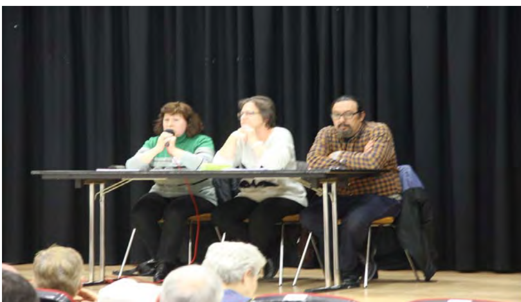
CENTRO CULTURAL LUCERO