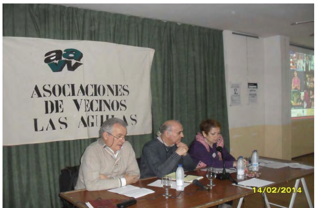
ASOCIACIÓN DE VECINOS DE LAS AGUILAS