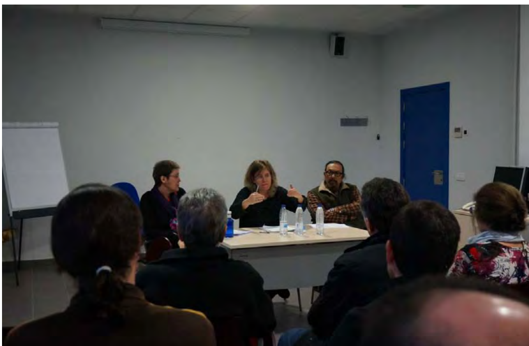
CENTRO CULTURAL MAQUEDA