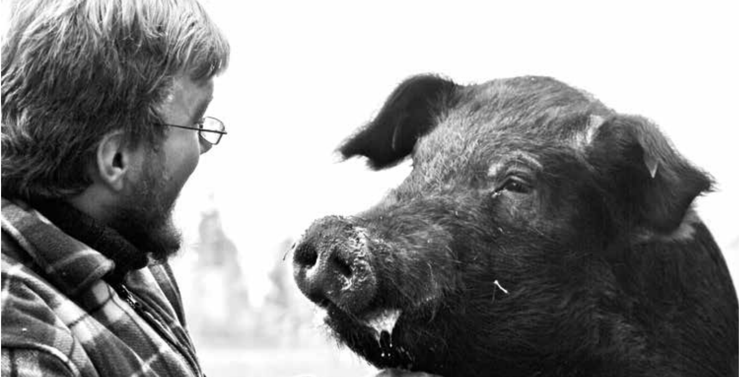
Encuentro entre hombre y cerdo en el Dottenfelderhof.