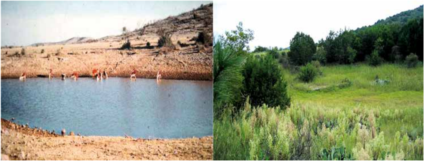
Parece una contradicción pero a través de un pastoreo inteligente el desierto se convierte de nuevo en campo verde.

sino con total compasión. En mi consulta he de compartir mi compasión no sólo con el animal sino también con el dueño. Yo curo al animal enfermo y llevo al dueño a desarrollar una relación adecuada con él. Entiendo al dueño gracias a la enfermedad de su animal, pues el animal