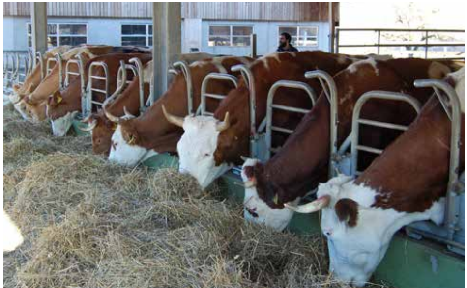
Comedero de rejas Demeter: incluso con cuernos, las vacas pueden evitar a los animales de más alto rango.

El identificarse con el animal resulta cuando nos impregnamos del ritmo respiratorio del animal. Tres actividades hacen posible una asociación a través del entendimiento: conocimiento, observación y sentir con el otro. Lo nuevo que nace a través de nuestra asociación con el animal, es la docilidad de los animales y nuestra soberanía en el trato con lo anímico, que no es propio nuestro, lo que podemos aprender muy bien en el trato con los animales. Animales que son bien tratados y bien atendidos pelean menos entre ellos que otras manadas que no están bien atendidas. No todo ni para siempre reside en la especificidad de la especie, sino