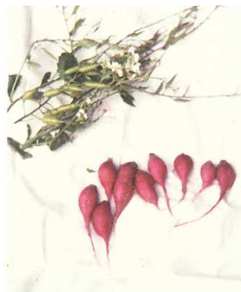
Rabanitos de días de hoja