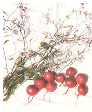
Rabanitos de días de raíz