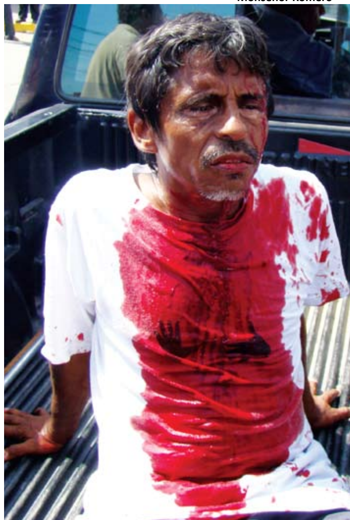
Siguen los heridos y golpeados.

"General no destruya a su pueblo y a su familia" eran las palabras de Zelaya desde un avión, para Romero Vásquez Velásquez, ante las imágenes que le dan vuelta al mundo y que ahora, dejan ver la manera en como se entiende la democracia por estos golpistas.