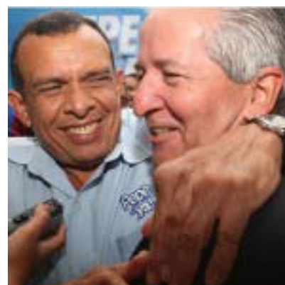
Pepe Lobo y Ricardo Maduro