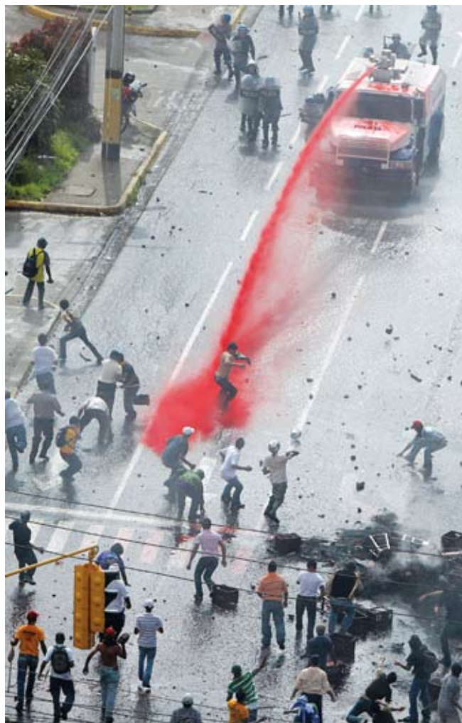
Manifestaciones se realizan en todo el país.

El gobierno golpista de Micheletti ha emprendido un ataque contra los manifestantes que esperaban la llegada del Presidente Manuel Zelaya Rosales al aeropuerto Toncontín de la ciudad capital Tegucigalpa.