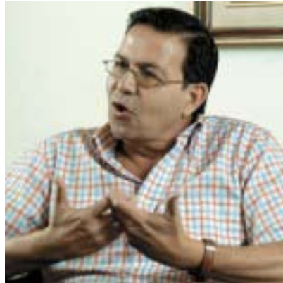
Rafael Leonardo Callejas