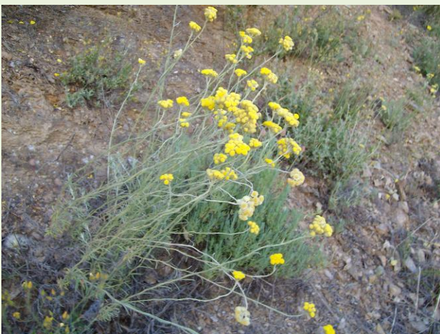
Helicriso (Helycrisum stoechas)

Ingredientes: Aceites vegetales, cera de abejas, Caléndula, Helicriso y aceite esencial de menta.