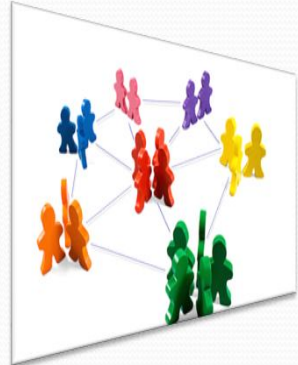
Modelo de negocio propuesto (basado en redes sociales)