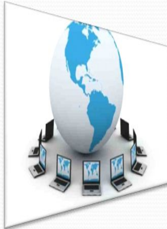
Modelo de negocio basado en Internet