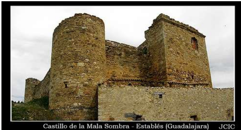
Castillo de la Mala Sombra - Establés (Guadalajara) JCIC