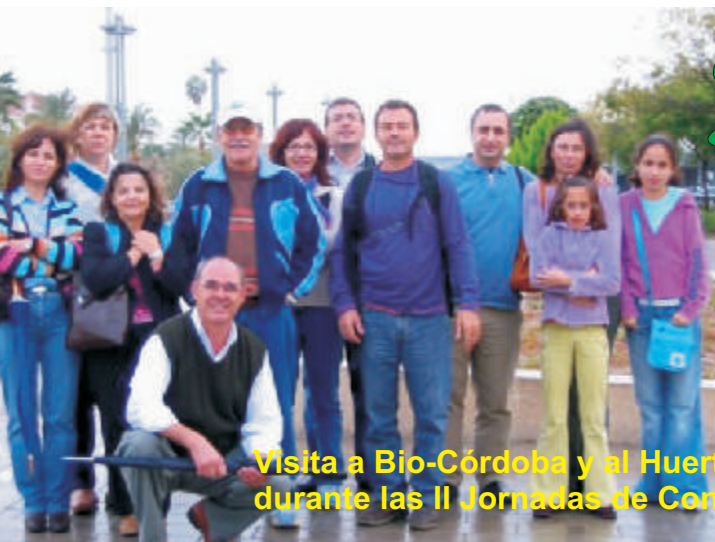
Visita a Bio-Córdoba y al Huerto Ecológico "El Ciruelo" en Écija, durante las II Jornadas de Consumo Responsable.

En esa elección de cada día es difícil separar el grano de la paja. El modelo imperante lo ocupa todo, lo abarca todo, está omnipresente, nos bombardea, nos manipula y orienta hacia su favor nuestras elecciones. Por ello, el papel que juega una asociación como La Talega es tan importante. Trabajamos para, poco a poco, poder ofrecer a los alcalareños, alternativas de ese otro mundo posible. Lo queremos ecológico. Lo queremos con un comercio justo. Lo queremos más humano, que el centro de todo sea la persona y no los beneficios. Lo queremos sano y con nuestro medio ambiente limpio. Queremos una sociedad sana que consiga un río Guadaira limpio, porque cuando esto suceda será la señal evidente de que la ciudadanía ha triunfado, de que la sociedad está en franca recuperación y, entonces, estará preparada para muchos otros retos.