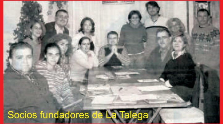
Socios fundadores de La Talega